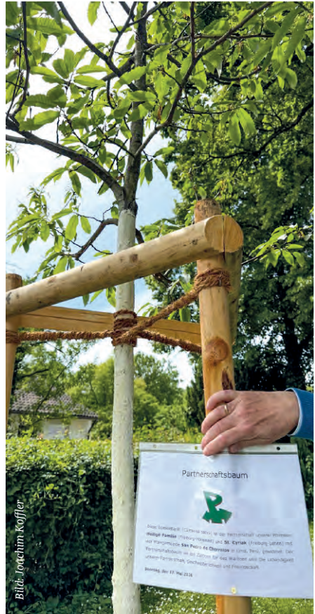
40 Jahre alt ist die Partnerschaft der Erzdiözese Freiburg mit Peru. In der Gemeinde Heilige Familie wurde nun ein sichtbares Zeichen der Verbundenheit gepflanzt und gesegnet: Ein Esskastanienbaum im Pfarrgarten erinnert an die immerhin auch schon 37jährige Partnerschaft mit der peruanischen Pfarrgemeinde San Pedro de Chorillos in Lima/Peru.